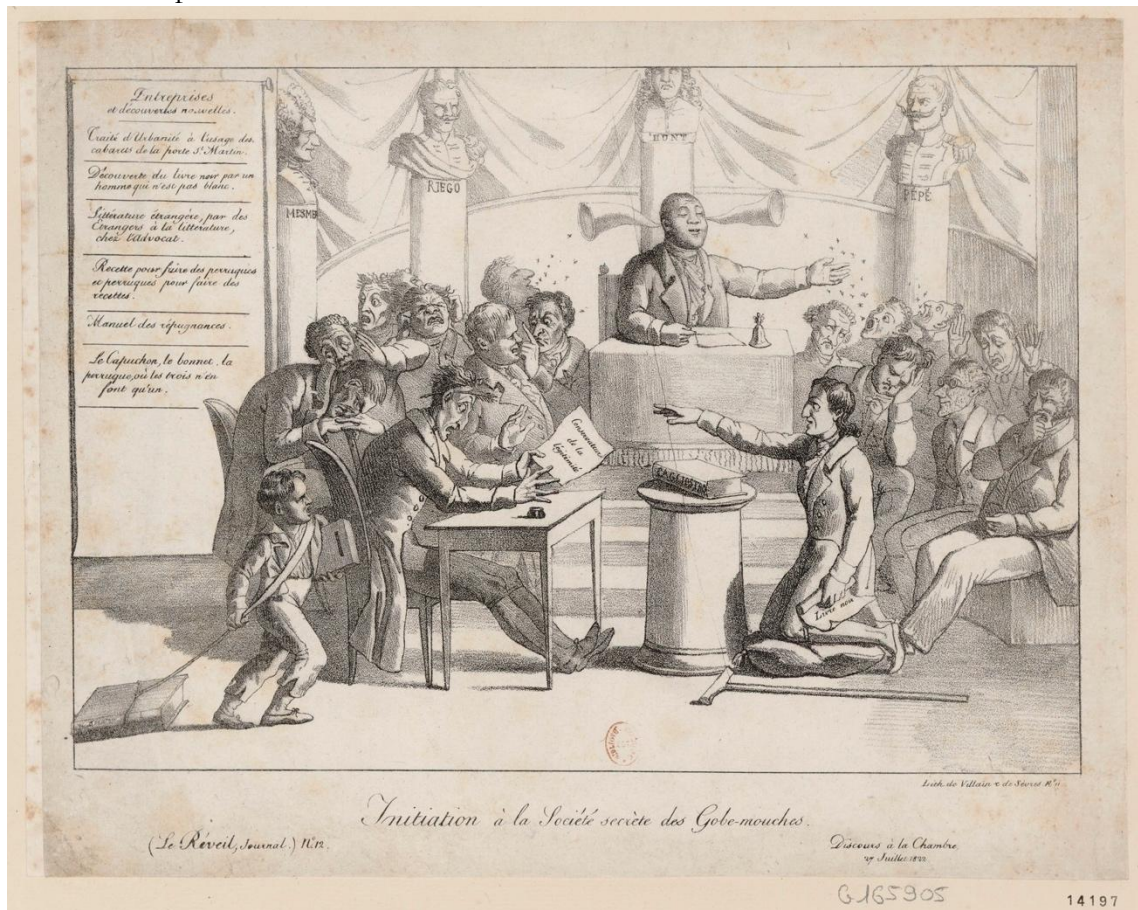
Figure 2. « Initiation à la société secrète des Gobe-mouches », lithographie dans Le Réveil , n° 12, 1822.

On notera également le caractère rhétorique de ces discours qui reprennent des plaidoiries : l'imaginaire des sociétés secrètes repose dans la presse sur l'éloquence judiciaire, qui fournit le cadre de sa représentation.