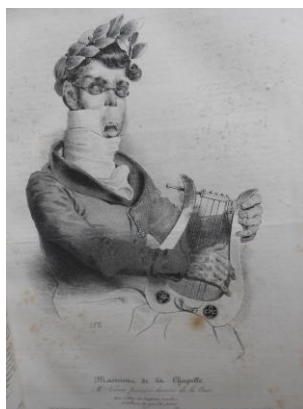
Fig. 1 : Traviès, « M. Viennet, premier chantre de la Cour », lithographie, Musiciens de la Chapelle, La Caricature , 5 décembre 1832.

Le pouvoir de représentation, par synecdoque, d'un individu par son accessoire est d'abord utilisé par Daumier et les caricaturistes politiques pour contourner la censure. Dans ses portraits-charges politiques, Daumier constitue en effet certains objets en emblèmes d'un personnage politique. Dans La Caricature , il représente les hommes politiques en buste, avec leurs « armes parlantes ». Il pastiche l'art héraldique en faisant des détails physiques et des attributs habituels d'un personnage ses « armes ». Dans le portrait-charge de Guillaume Viennet, député de la monarchie de Juillet et poète, Daumier reprend la lyre avec laquelle Traviès l'avait représenté dans une caricature du 5 décembre 1832 de La Caricature [Fig. 1] et l'insère dans ses « armes parlantes », dans une caricature du 5 juin 1833 [Fig. 2]. De même, dans le portrait-charge du 20 juin 1832 du journal La Caricature , le grand nez de d'Argout apparaît dans son blason, avec les ciseaux de la censure 2 .