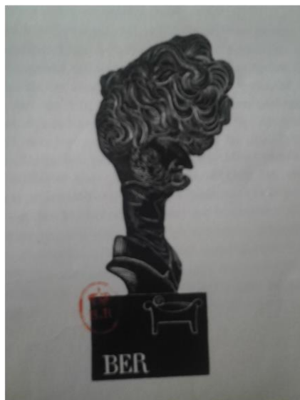
Fig. 5 : Berlioz, gravure sur bois de Maurisset d'après Dantan, Musée Dantan, Paris, H. Delloye, 1839.

Hugo et Jules Janin, mais aussi Delaroche et David d'Angers sont représentés de la même façon que dans l'œuvre de Roubaud. Daumier reprend exactement la charge de Roubaud de 1836 de Victor Hugo dans un fauteuil du moyen-âge. La chevelure de Berlioz est, quant à elle, la même que celle que Dantan lui a donnée dans sa statuette.