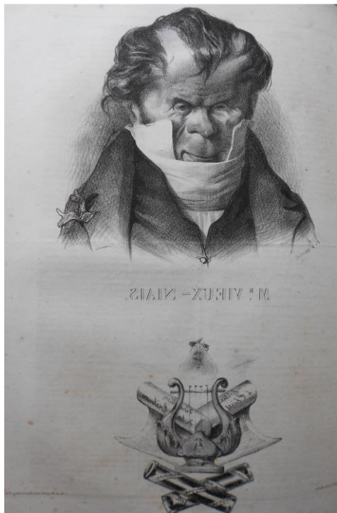
Fig. 2 : Honoré Daumier, « M. Vieux-niais », lithographie, La Caricature , 5 juin 1833.

Ces attributs constitués en emblèmes peuvent ensuite représenter seuls les personnages, comme le montre la caricature de Grandville et Forest du 27 décembre 1832 qui offre, en guise d'étrennes, des « Joujous politiques » de « Philipon et compagnie 3 ». On reconnaît, en haut à gauche, un faux nez vert et des ciseaux, « armes » de M. d'Argout, tandis qu'au centre, une chevelure noire bouclée et pointue (piriforme), un coq tricolore et une truelle symbolisent Louis-Philippe. Ces accessoires se voient ainsi dotés de la capacité à représenter seuls leurs propriétaires.