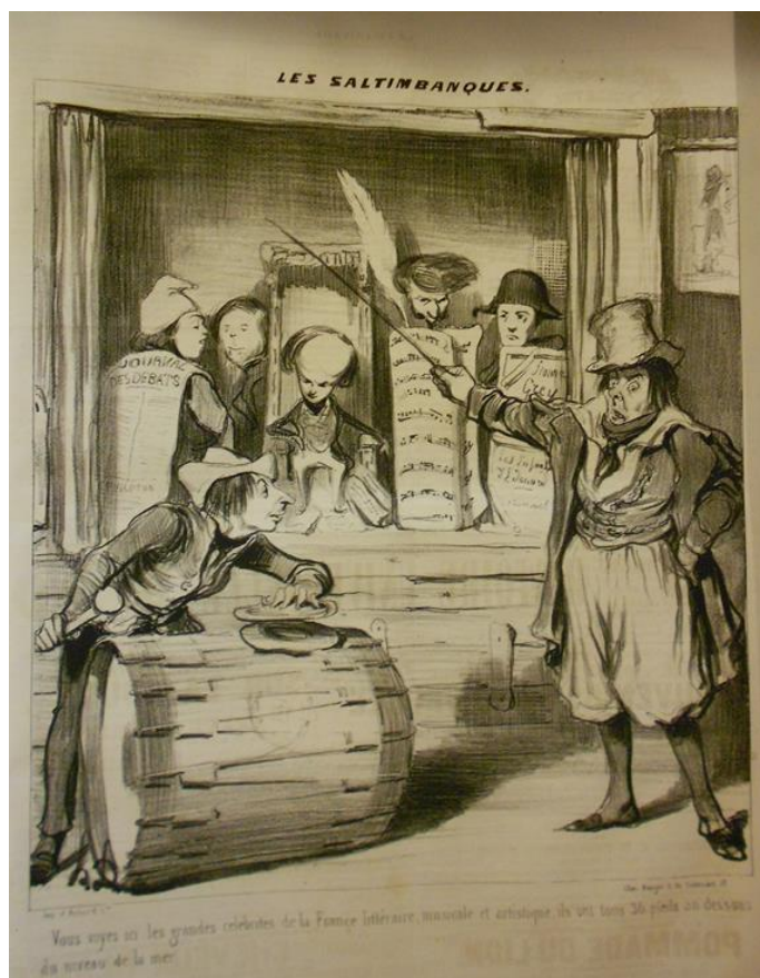
Fig. 4 : Daumier, « Les saltimbanques », lithographie, Le Charivari , 5 avril 1843.

Or, dans la caricature de Daumier de 1843 intitulée « Les saltimbanques », dans laquelle Robert Macaire et Bertrand montrent un théâtre de marionnettes artistiques et littéraires, Daumier reprend les codes iconographiques de Dantan et de Roubaud.