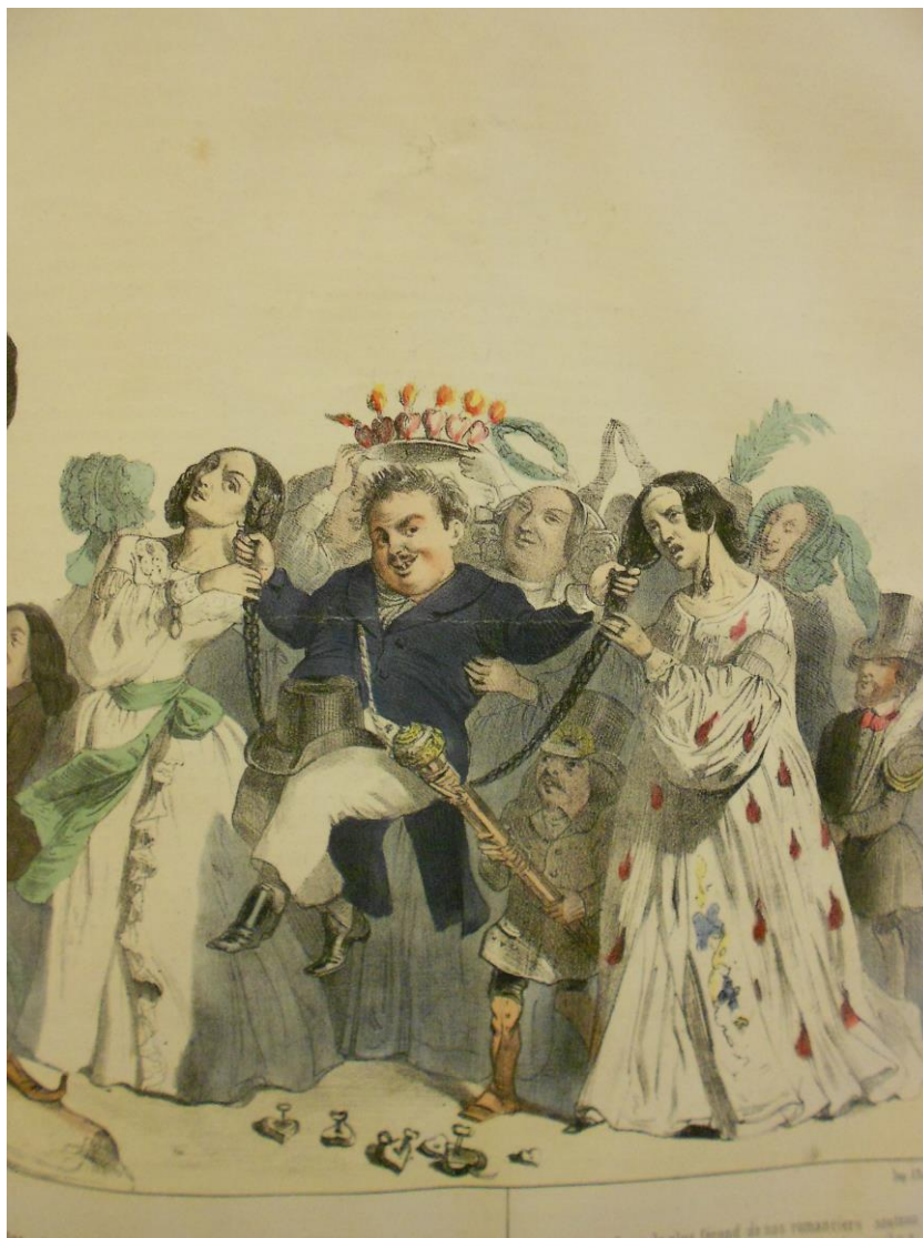
Fig. 6 : Grandville, « Grande course au clocher académique », lithographie, détail, 29 décembre 1839, La Caricature provisoire .

Sur la deuxième planche de la « Grande course au clocher académique » publiée le 16 février 1840 dans La Caricature provisoire 18 , Janin, Frédéric Soulié et Léon Gozlan sont également représentés de la même manière que dans le Panthéon charivarique . Jules Janin, assis à gauche, a le même bonnet de nuit que dans le Panthéon charivarique et Frédéric Soulié, avec une robe rouge et le diable sur son dos, à droite de l'image, a la même coiffure, la même moustache et les mêmes souliers à la poulaine que dans le Panthéon charivarique . Ces deux planches seront à nouveau publiées les 19 et 20 février 1844 dans Le Charivari . Sur la première planche, Eugène Sue remplacera Victor Hugo.