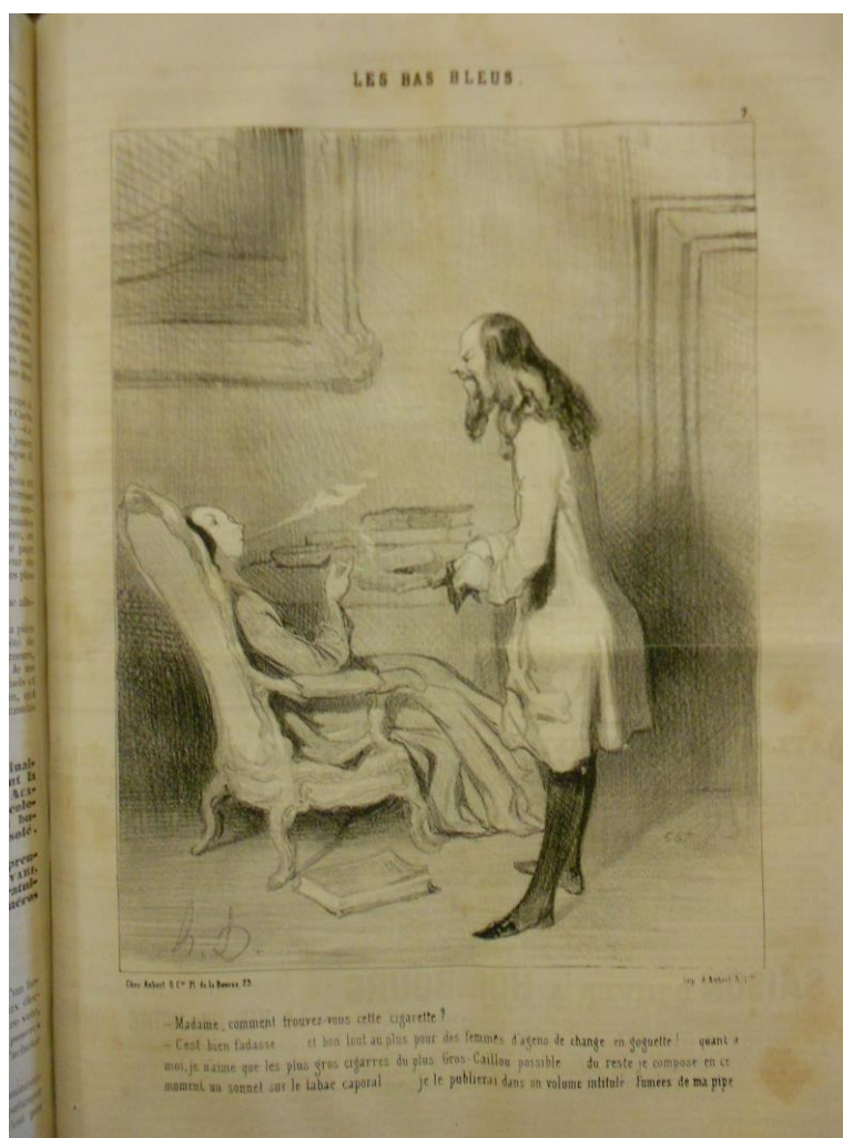
Fig. 8 : Daumier, « Madame, comment trouvez-vous cette cigarette ? », Les Bas-bleus , lithographie, 1 er mars 1844, Le Charivari . (Photographie : Amélie de Chaisemartin)

filiation avec la figure de la romancière est plus forte car les bas-bleus fument. La caricature du 1 er mars 1844 insiste particulièrement sur ce trait. Un homme demande à un bas-bleu comment elle trouve la cigarette qu'il lui a donnée et elle répond : « C'est bien fadasse...et bon tout au plus pour des femmes d'agent de change en goguette !... quant à moi, je n'aime que les plus gros cigares du plus Gros-Caillou possible ! » [Fig. 8] Dans une caricature du 7 mai 1844, le bas-bleu fume même de l'opium. Daumier montre explicitement que George Sand est le modèle de tous les bas-bleus dans une caricature du 18 juillet 1844 du Charivari , dans laquelle une femme de lettres crie, furieuse, à une autre : « Ah ! vous trouvez que mon premier roman n'est pas tout à fait à la hauteur de ceux de George Sand... ! Adélaïde, je ne vous reverrai de la vie ! » Ce type est consacré par la Physiologie du Bas-Bleu , écrite par Frédéric Soulié et publiée en 1844. Dans la vignette qui introduit le chapitre consacré au « Bas-bleu libéré », une jeune femme accoudée à une cheminée fume, comme George Sand. Le type individualisé, c'est-à-dire l'image caricaturale reconnaissable d'un auteur ou d'un artiste, peut donc donner naissance à un type physiologique, qui lui reprendra certains accessoires emblématiques.