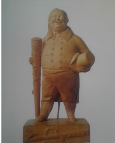
Fig. 3 : Statuette d'Honoré de Balzac par J.-P. Dantan, 1835, plâtre teinté, 34 cm, Maison de Balzac.

Dans le Musée Dantan de 1839, Louis Huart commente ainsi la reproduction de la statuette :