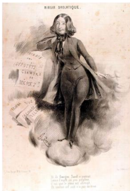
Fig. 7 : George Sand, « Miroir drolatique », Lorentz, Le Charivari , 5 août 1842.

« Miroir drolatique » du Charivari , paraît une caricature de George Sand par Lorentz qui restera célèbre : George Sand, vêtue d'habits d'homme, est enveloppée d'un épais nuage formé par la fumée de son cigare.