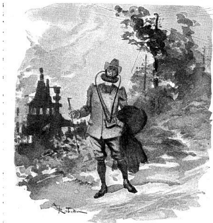
Phonographic Literature for the Promenade.

D'après le narrateur, la mort annoncée de l'imprimerie serait rendue inéluctable par « les divers enregistreurs du son qui ont été récemment découverts 7 », notamment par le phonographe dont le brevet avait été déposé par Edison en 1877. En alléguant que le confort de l'écoute aura nécessairement la faveur du public aux dépens des efforts de la lecture, le bibliophile prévoit que les livres seront bientôt supplantés par des phonographes portatifs comprenant de minuscules cylindres sur lesquels sera directement enregistrée la voix de l'auteur.