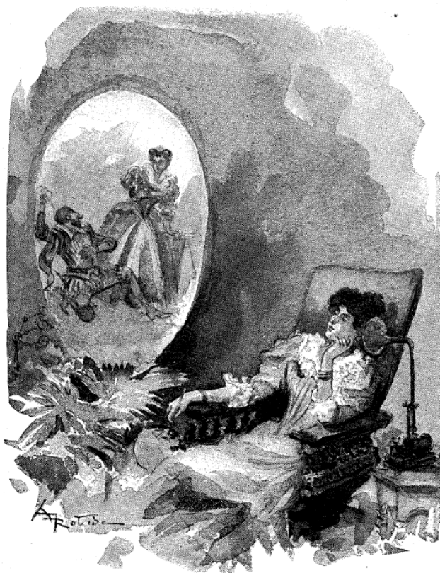
The Romance of the Future. (With Kinetoscopic Illustrations.)

imprimées et rapportées plus ou moins exactement ; on voudra entendre l'interviené 13 ». Le narrateur se plaît dès lors à imaginer des lecteurs métamorphosés en auditeurs, « Étendus sur des sofas ou bercés sur des rocking-chairs , [qui] jouiront, silencieux, des merveilleuses aventures dont des tubes flexibles apporteront le récit dans leurs oreilles dilatées par la curiosité 14 ». Pour forcer l'anachronisme de l'image, on est tenté de substituer aux « tubes flexibles » des phonographes des tubes cathodiques, et aux « oreilles dilatées » des auditeurs des yeux tout aussi dilatés, en les transformant à leur tour en spectateurs. Ce qui n'est d'ailleurs pas éloigné des anticipations exposées par le bibliophile d'Uzanne, qui observe, en se référant au kinétographe récemment inventé par Edison et converti en prototype télévisuel, que « non seulement nous le verrons fonctionner dans sa boîte, mais, par un système de glaces et de réflecteurs, toutes les figures actives qu'il représentera en photo-chromos pourront être projetées dans nos demeures sur de grands tableaux blancs 15 ».