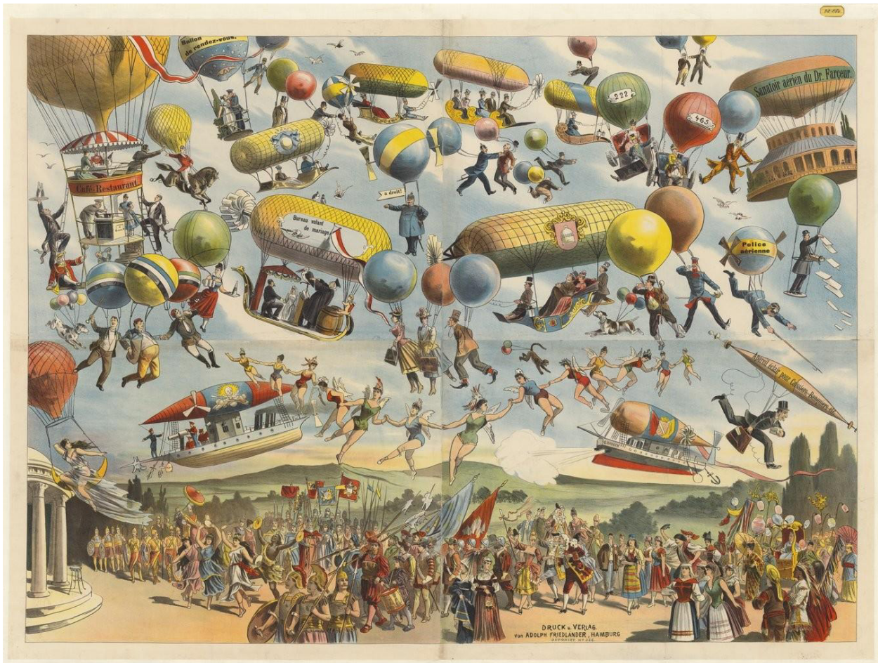
3 - G. RODECK, Sanatoir aérien du docteur Farceur, bureau volant de mariage, police aérienne , lithographie en couleur, 120 cm x 160 cm, Hambourg, s.n., 1890.