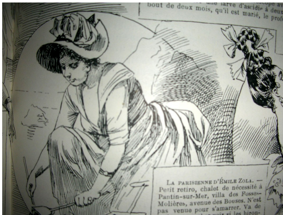
La Parisienne de Zola, vue par la Vie parisienne , « Petit retiro, chalet de nécessité à Pantin-sur-Mer, villa des Fosse-Molières, avenue des Bouses. ». Ferdinand BAC, « Sur la plage – où ils les envoient », in la Vie parisienne du 10 septembre 1887, p. 512-513.