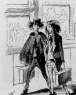
12291 — Il n'est pas trop Courbet avec le poids des récompenses. — Ma loi, au lieu d'aller à un si beau rendez de bataille, que je lui en aie fait donner une.