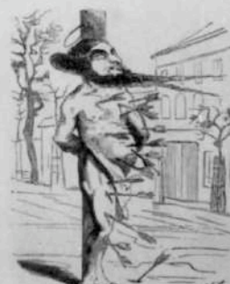
12275 Martyre de saint Courbet, maître peints.