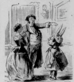
12288 On assure que cette méconnaissance exemplaire vient de lui annoncer le mariage de Mousquet.