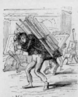
12289 Déménagement de l'exposition des Beaux-Arts. — En l'an 4234 tout est à peu près à grand'course! Et dire qu'on ne peut pas seulement s'en faire des échantons à l'heure qu'il est.