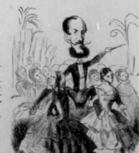
12276 Cités des laïcs de Janine-Hiver. Oracles traditionnelles de Mousquet.

Nadar : « Revue du quatrième trimestre de 1855 », Le Journal amusant , 5 janvier 1856.