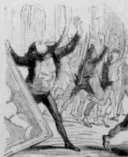
12274 Dissens de M. Courbet. La police des communications se refuse au transport de sa baguette.