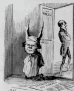
12287 Juste richement indigné au jeune Mousquet par la Presse pour s'en être pas mis assez à tirer son roman de la France-Magnifique des femmes.