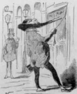
12272 M. Courbet, qui trouve que la critique ne l'insulte pas assez, va demander à la Courbet l'annonce le jour de l'année. — Prenez garde, monsieur, j'ai de l'homme-préparé à mourir!