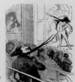
12292 Arrêt sous le titre de Courbet aux Variétés. Courbet, tant de voir qu'il se moque rien à sa gloire, se change en une fleur qui porte ses sems.