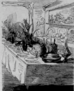
12282 Nouveaux genres de cabinets de travail.