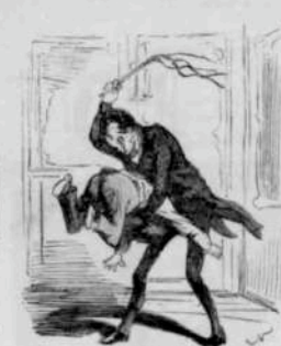
12286 Voir la Presse de...