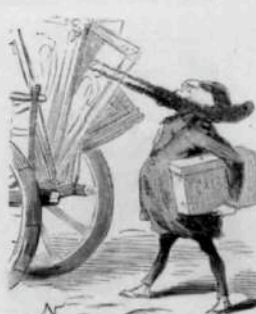
12290 Déménagement de l'exposition Central. Il n'y a pas besoin de voiture pour porter le cahier.