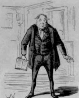
12281 — Moi, je trouve une chose très-bien dans ce roman-là, c'est le titre!