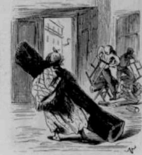
12284 Falsaterie annuelle et périodique à l'usage d'un désinateur aux abois.