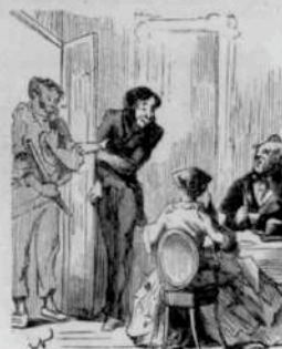
12285 — Je vous remercie de tout ce que vous devez attendre impatiemment à Kiste et le sucre de lait!