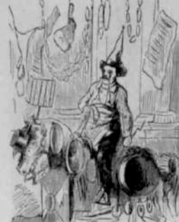
12283 Costume proposé par le fondateur de prix Véron pour le triomphe.