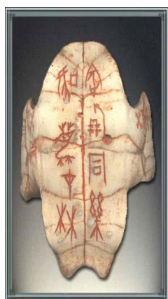
Inscriptions sur carapace de tortue datées du XI e siècle av. A.-C.

Les plus anciens documents qui nous sont parvenus attestant l'usage de l'écriture chinoise remontent au XIV e siècle avant notre ère. Ces inscriptions sur os ou carapaces de tortue, découvertes à partir de la fin du XIX e siècle 25 et appelés jiaguwen , révèlent un système d'écriture déjà assez avancé, malgré leur aspect plus ou moins « figuratif » sur le plan graphique.